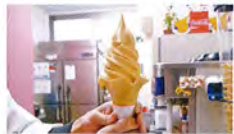
トマトの酸味がさわやか。ご当地ソフトの「サンシャイントマト」(330円)