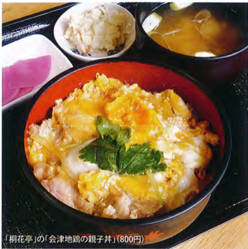
「桐花亭」の「会津地鶏の親子丼」(800円)

大沼郡三島町川井天原屋610 TEL.0241-48-5677 ★「味処 桐花亭」10:00~16:00 ★物販8:00~18:00