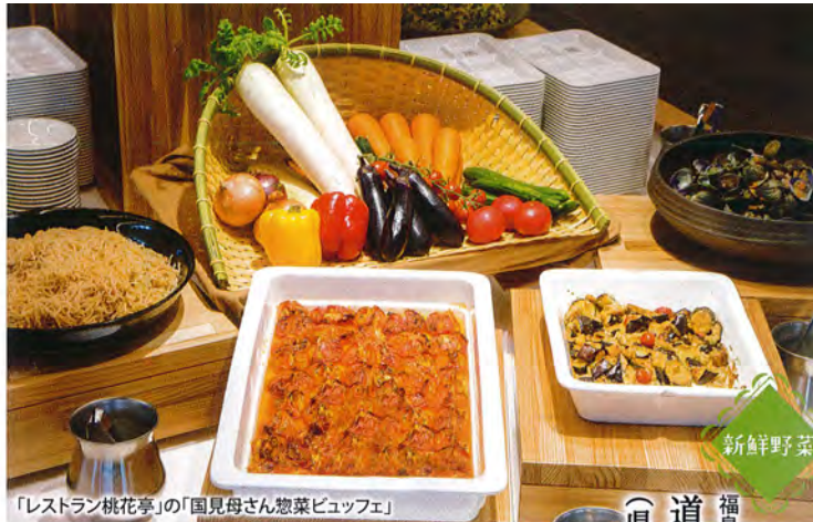
「レストラン 桃花亭」の「国見母さん惣菜ビュッフェ」

人気のブランド地鶏をリーズナブルにいただく ほかほかの会津産のはんの上に、奥会津のブランド地鶏「会津地鶏」のモモ肉と胸肉、金色に輝くふわふわ・とろとろの卵がたっぷり。地元農家が丁寧に育てた会津地鶏は、程よくプリッとした食感と噛みしめるごとににじみ出るうまみが魅力。他にもカレーや唐揚げなど、リーズナブルなメニューが揃っています。物販コーナーでは、地元カフェの手づくりお菓子や山ブドウの蔓などで作られた「奥会津編み組細工」をチェック！