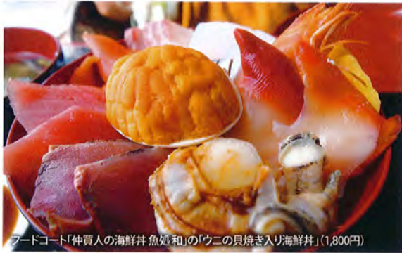
フードコート「仲買人の海鮮丼 魚処 和」のウニの貝焼き入り海鮮丼(1,800円)